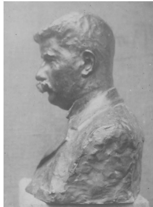
Constantin Brancusi, Portrait du propriétaire d'un restaurant, plâtre patiné ? (1905)